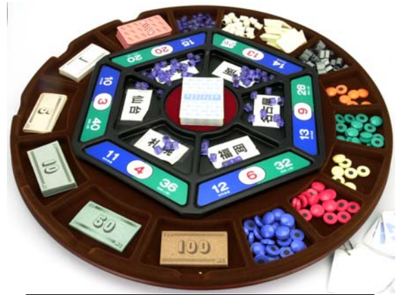
【写真はMGのマーケット盤】 1卓4～6名でゲームを行います。

ソフトバンクの孫正義社長は、ソフトバンク創業の1年前（1980年）23歳の時に博多でMG公開セミナーを受講し、後年、「MGを体験していなかったら今日のソフトバンクはなかった。」と述懐しています。